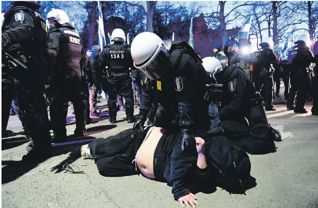
Pelipaikoilla. Tämän kuvan ottanut STT-Lehtikuvan kuvajournalisti Martti Kainulainen kuvasi itsenäisyyspäivän mielenosoituksen kahinoita lähietäisyydeltä. Pressiliivi takasi sujuvan yhteistyön viranomaisten kanssa.