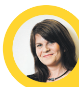
Outi Alanko-Kahiluoto, kansanedustaja, kaupunginvaltuutettu (vihr.):

"LAINSÄÄDÄNTÖ EI tunnista itsensä työllistäjiä riittävästi, ja esimerkiksi sosiaaliturvan varmistaminen on usein vaikeaa. Siinä osuuskunta voi olla korvaamattomaksi avuksi.