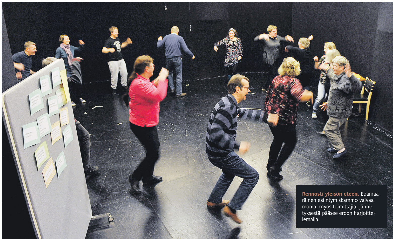
Rennosti yleisön eteen. Epämääräinen esiintymiskammo vaivaa monia, myös toimittajia. Jännityksestä pääsee eroon harjoittelemalla.