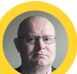
Jari Lindström, oikeus- ja työministeri:

"MEDIA-ALALLA freelancereita on enemmän kuin muilla aloilla, joten tällaiselle toiminnalle on varmasti kysyntää. Ammattiliiton perustaman osuuskunnan hyvä puoli on se, että sen jäsenten etuja pyritään ajamaan tavoittelematta voittoa osuuskunnalle itselleen.