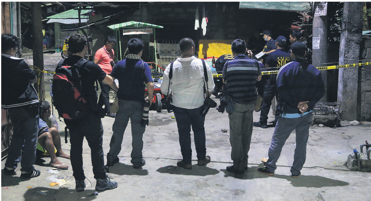
Tapahtumapaikalla. Median edustajat – kuvaajat ja toimittajat – ovat nähneet kaduilla tuhansia ruumiita laittomien teloitusten jäljiltä. Kaikkiaan Filippiinien huumesodassa on tapettu ilman oikeudenkäyntiä yli 8 000 ihmistä, joiden poliisi sanoo käyttäneen tai myyneen huumeita.