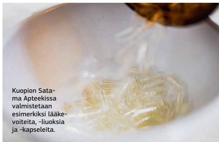
Kuopion Sata-ma Apteekissa valmistetaan esimerkiksi lääkevoiteita, -liuoksia ja -kapseleita.