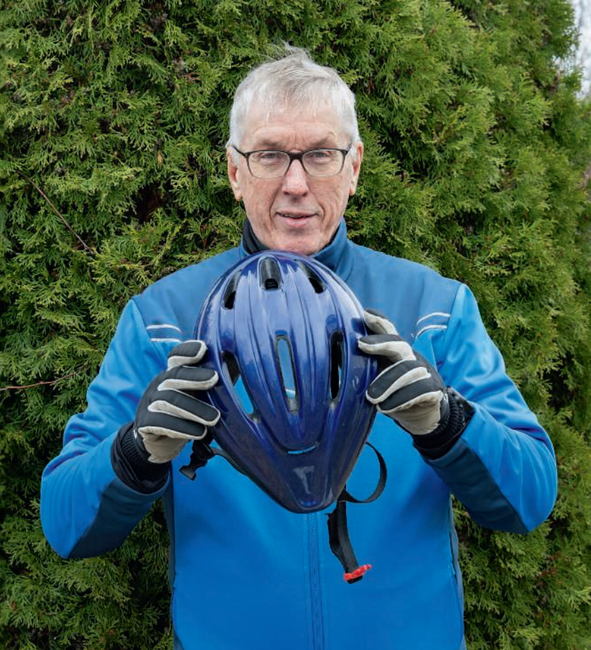
Pyörän selkään Liikala hyppäsi heti, kun se oli jälleen mahdollista, ja liikunta maistui taas.