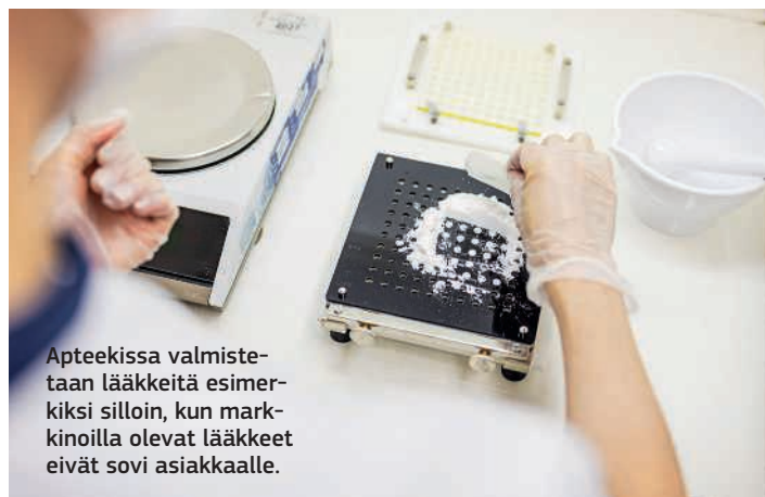
Apteekissa valmistetaan lääkkeitä esimerkiksi silloin, kun markkinoilla olevat lääkkeet eivät sovi asiakkaalle.

”Lääkevalmistus auttaa varmistamaan, että asiakas saa juuri oikeanlaisen lääkkeen vaivaansa.”