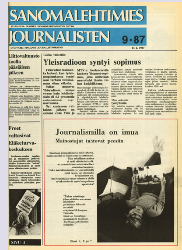
Sanomalehtimies 9/1987 käsitteli kesäharjoitteluja.