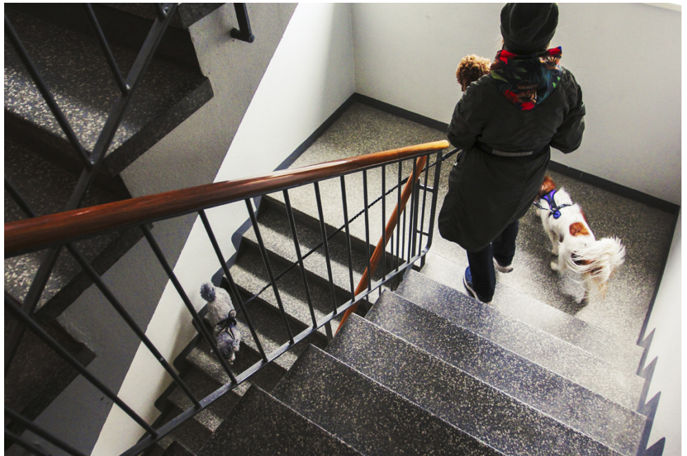
Tulot riittävät nykyiseen elämäntapaan hyvin, Kylvén sanoo. Koiriin kuluu kyllä rahaa, mutta menot ovat pienemmät kuin esimerkiksi kollegoilla, joilla on lapsia.

”Pystyisin varmasti tekemään enemmän töitä, mutta arvostan myös vapaa-aikaa.” ●