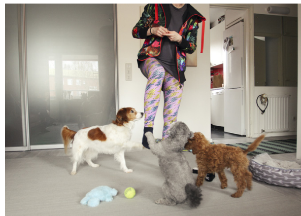
Koirat Merel, Lio ja Puri saavat jumppatuokion kesken työpäivän.