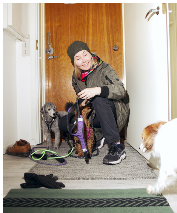
Freetyö mahdollistaa ulkoilun valoisaan aikaan kaikkina vuodenaikoina.