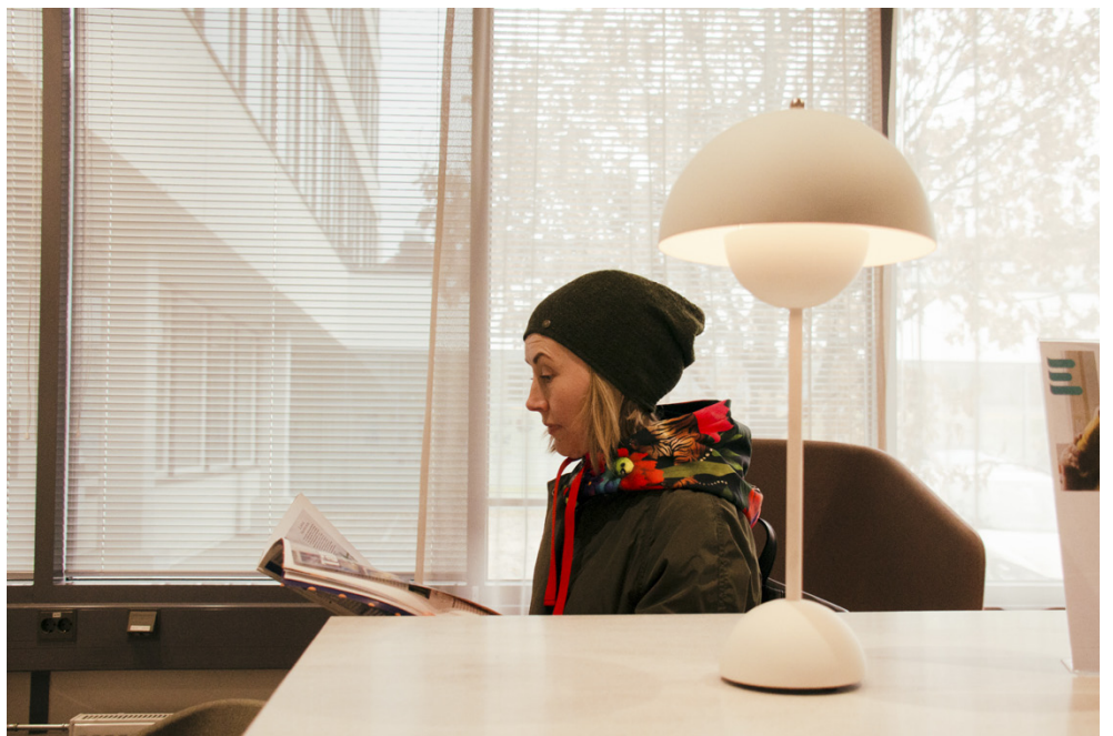
Lounastauolla Kylvén käy Sampolan kirjastossa lukemassa lehtiä.

viettää säännöllisesti aikaa toisella paikka- kunnalla, jossa hänen puolisonsa asuu.