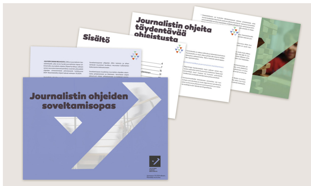
Journalistin ohjeiden soveltamisopas auttaa toimituksia tulkitsemaan alan uusia sääntöjä. Opas on julkaistu Julkisen sanan neuvoston verkkosivuilla.