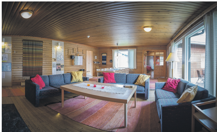
Jäsenpalvelut uudistuvat. Journalistiliiton Saariselän mökkien varauskäytännöt muuttuvat, kun välityspalvelut siirtyvät uudelle yritykselle. Kuva on Tunturimajasta.