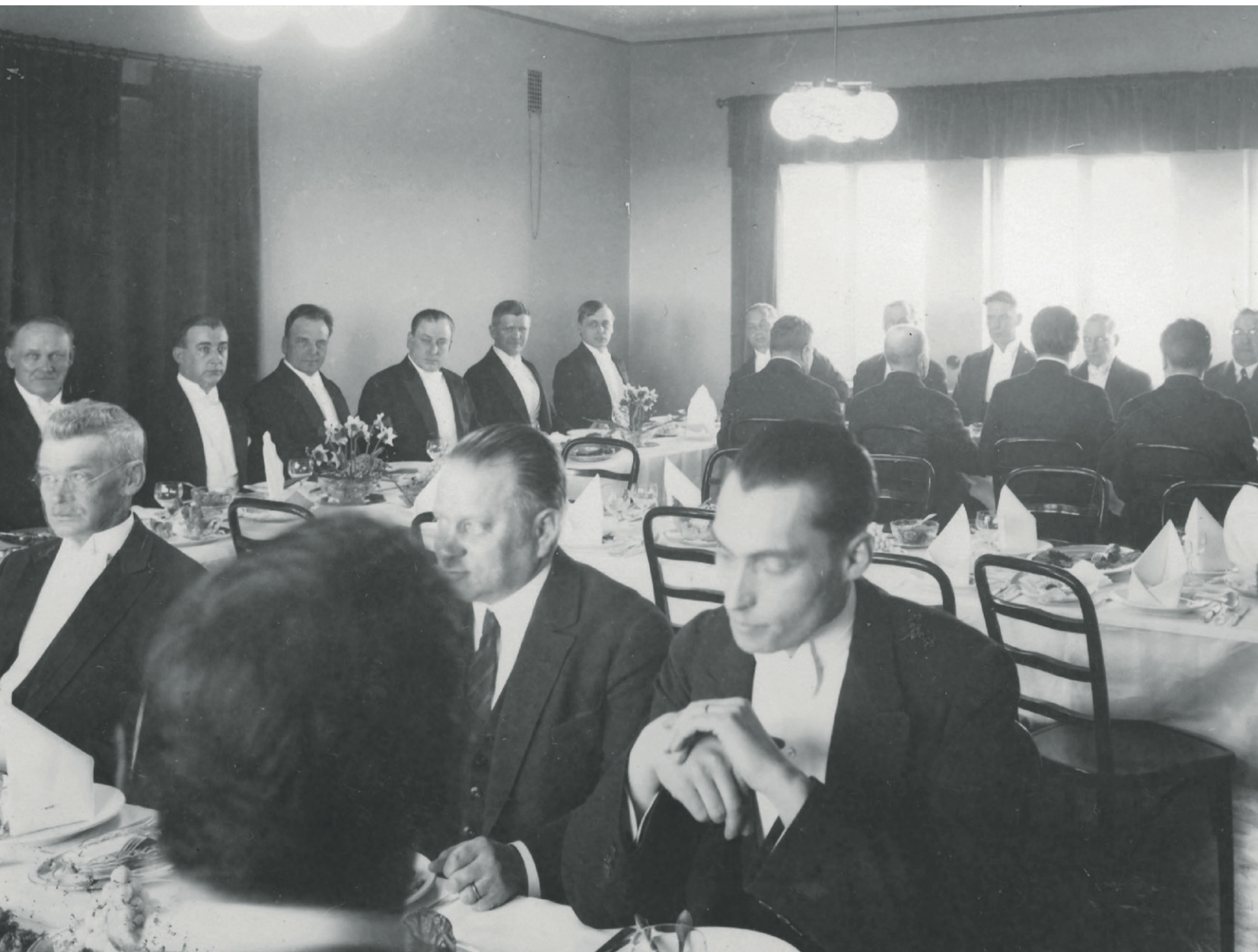
Ensimmäinen vuosikymmen. Liiton vuosikokouksen yhteydessä toimittajien edustajat kokoontuivat yhteiselle illalliselle. Kuva on vuodelta 1931, jolloin liitto täytti kymmenen vuotta.

kon radio- ja televisiolakkoon. Edunvalvontaa leimasivat sopeutuminen kansantalouden nopeisiin muutoksiin, toinen toistaan seuraavat tulopoliittiset neuvottelut ja yritykset omien työehtosopimusten avulla joko pysyä vauhdissa mukana tai irrottautua siitä.