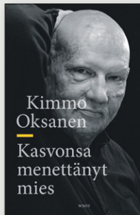
KIMMO OKSANEN: KASVONSA MENETTÄNYT MIES. WSOY 2015.