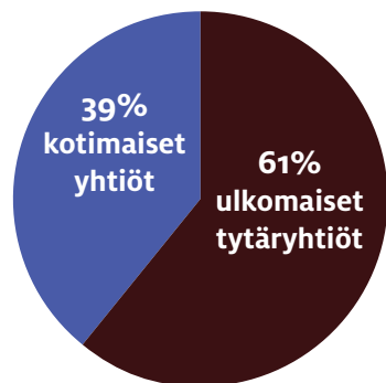
Osuus SATU ry:n jäsenten liikevaihdosta 2016

KOONNUT: TIMO-ERKKI HEINO LÄHTEET: SATU RY JA YHTIÖIDEN TILINPÄÄTÖKSET