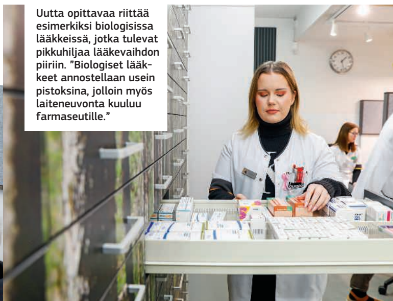
Uutta opittavaa riittää esimerkiksi biologisissa lääkkeissä, jotka tulevat pikkuhiljaa lääkEVaihdon piiriin. ”Biologiset lääkkeet annostellaan usein pistoksina, jolloin myös laiteneuvonta kuuluu farmaseutille.”