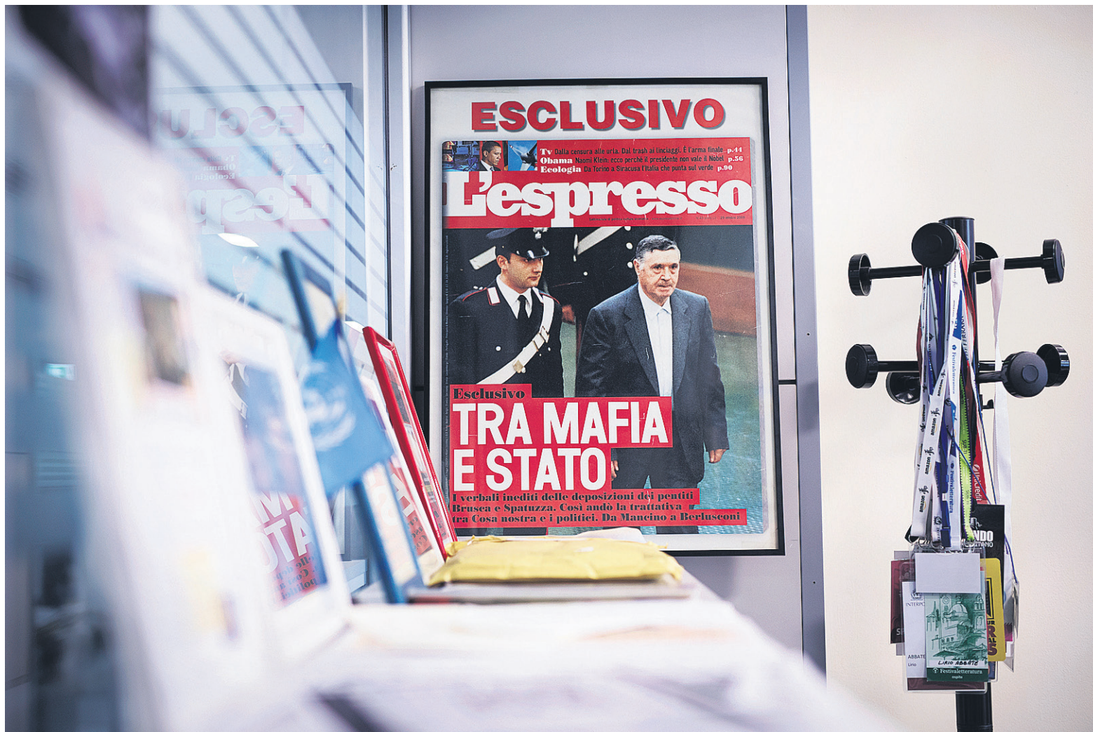
Yhteys mafian ja valtion välillä. Lokakuussa vuonna 2009 l'Espressoissa ilmestyneessä kansijutussaan Lirio Abbate paljasti yhteyksiä Sisilian mafian ja Italian entisen pääministeri Silvio Berlusconiin Forza Italia -puolueen välillä.

tölle oikeuslaitosta suurempi uhka. Oikeusprosessia voi ohjailla, mutta arvostetun toimittajan juttu voi tehdä lopun laittomista bisneksistä”, Abbate sanoo.