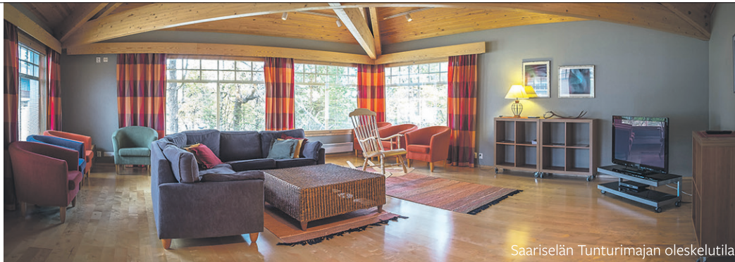
Saariselän Tunturimajan oleskelutila.