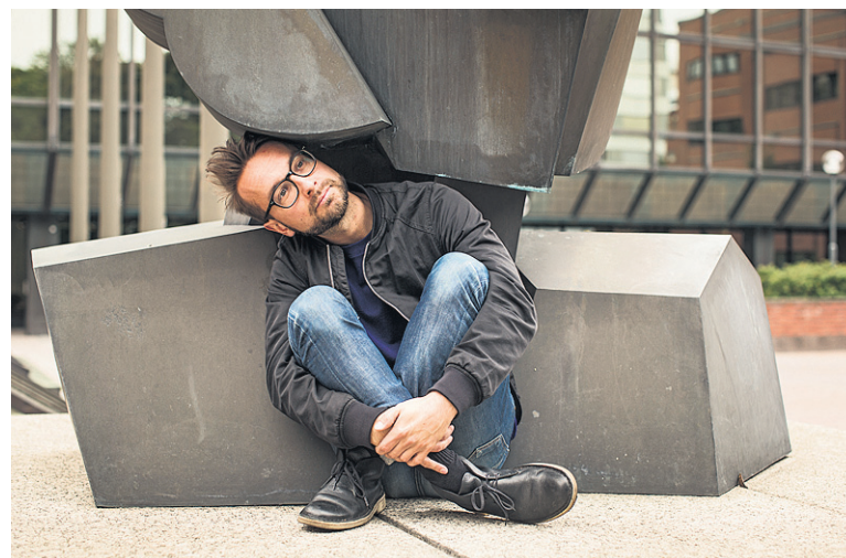
Vallan linnakkeella. Valokuvaaja Sakari Piippo Helsingissä sijaitsevan Kuntatalon Urbanisti-patsaalla.

Häntä mietityttää, miksi edustuksellinen demokratia ei tunnu