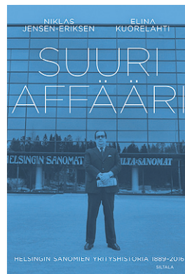
SUURI AFFÄÄRI – HELSINGIN SANOMIEN YRITYSHISTORIA 1889– 2016. SILTALA 2017.