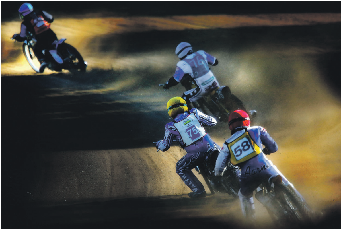
Valoa kuvaan. Valokuvaaja Eetu Sillanpää kuvasi speedway-kilpailuja elokuussa. Kuva julkaistiin Pohjalaisessa 31. elokuuta.