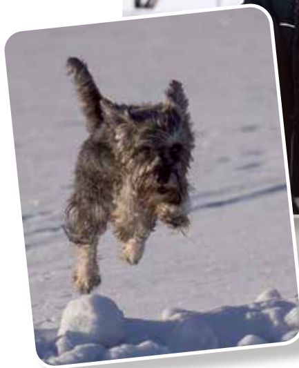
Otto ja Eva