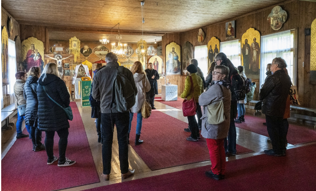
Savo-Kainuun ja Pohjois-Karjalan journalistiyhdistysten vierailu Valamoon alkoi Vanhasta kirkosta.