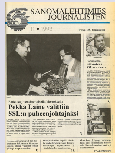
Sanomalehtimies Journalisten 11/1992.