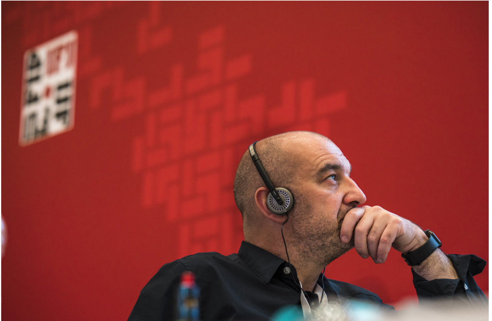
Ranskalainen Anthony Bellanger on toiminut IFJ:n pääsihteerinä vuodesta 2015. Suomen Journalistiliiton mahdollisiin eroaikeisiin Bellanger ei tässä vaiheessa ota kantaa.