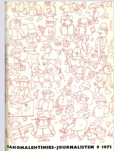
Sanomalehtimies 9/1971 kritisoi suomalaista Afrikka-journalismia.

Kirjoittaja on Journalistiliiton kansainvälisten asioiden asiantuntija.