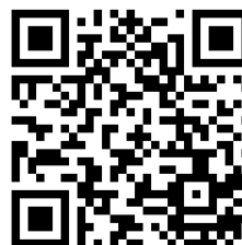
KSI KARTING '17