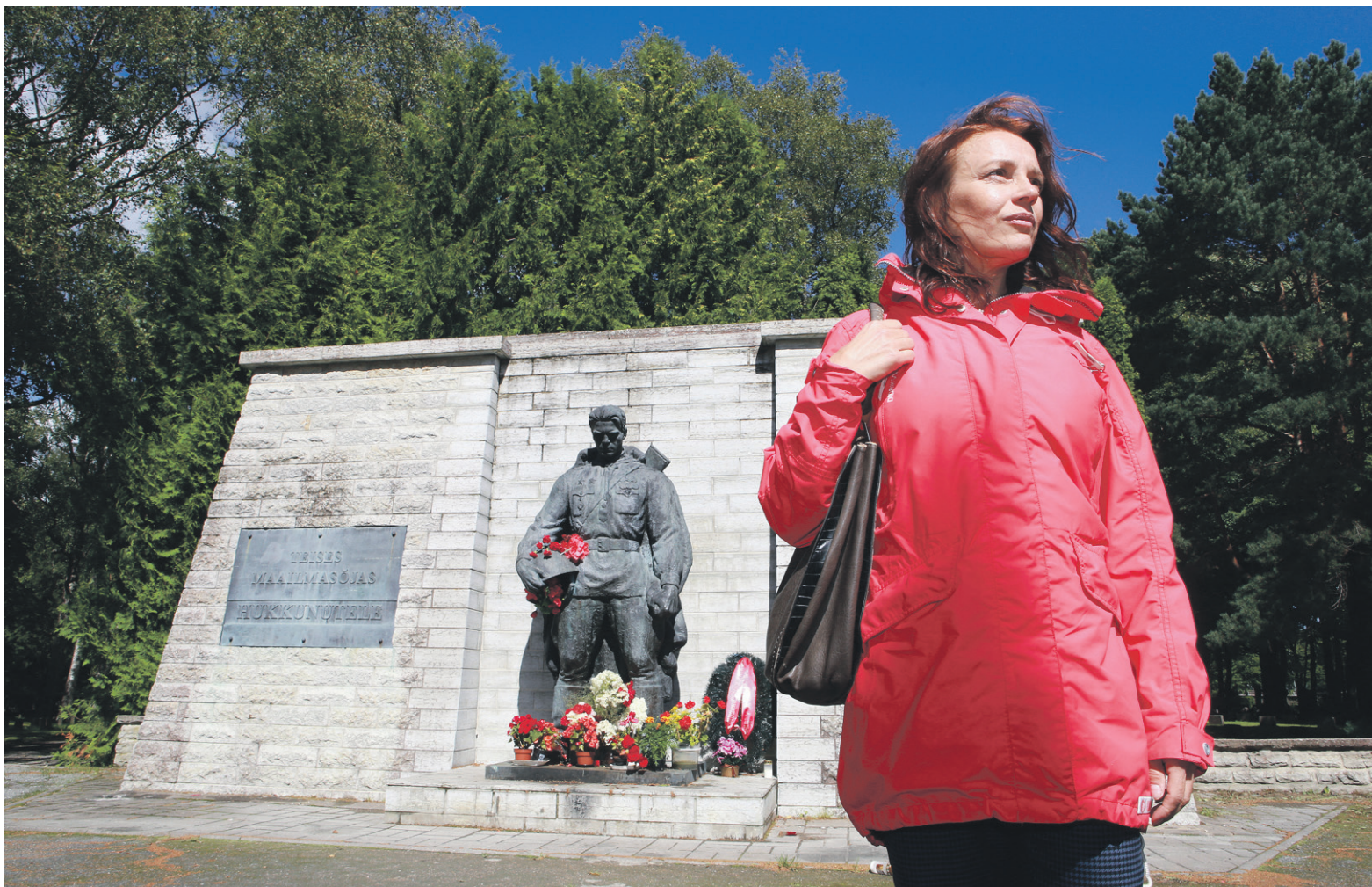
Konflikti hetkautti. Neuvostoaikainen pronssipatsas siirrettiin 2007 mellakoiden saattamana kirjaston edestä hautausmaalle. Mellakat horjuttivat Kunnaksen turvallisuudentunnetta.

Reilu kymmenen vuotta myöhemmin Tallinnassa oli erilaista. Hän huomasi viihtyvänsä, rakastui ja jäi.