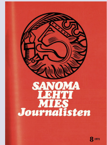
Sanomalehtimies – Journalisten 8/1971 valitteli verottajan kohtuutonta toimintaa.

Kirjoittaja on Journalistiliiton edunvalvontajohtaja.