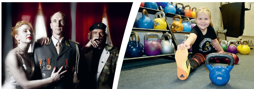
Ooppera ja kahvakuulakisat ovat kylän erikoisuuksia.

Sumiaisten vahva identiteetti on rakentunut jo satojen vuosien ajan. Maaseutukylä kaupunkitaajamien kyljessä ottaa vieraat hymyillen vastaan. Tuntuu, että täällä aika kulkee verkkaisesti eikä kesä lopu koskaan. Vapauden tunne säilyy ympäri vuoden. Havahdut siihen, että hiljaisuus houkuttelee huomaansa.