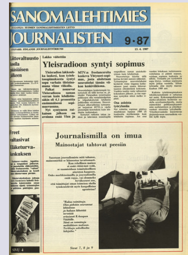
Sanomalehtimieheissä 9/1987 kirjoitettiin uudesta harjoittelumallista.