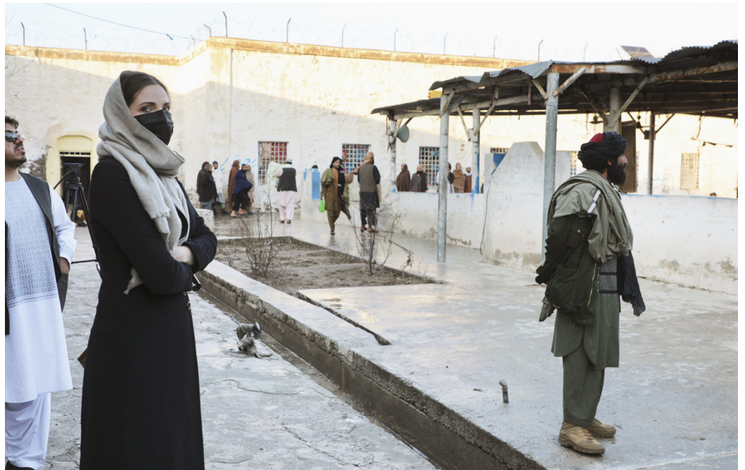
Sodan päätyttyä Liuhto voi matkustaa Afganistanissa myös Kabuln ulkopuolelle. Vuoden alussa Liuhto oli Kandaharin kaupungin keskusvankilassa tekemässä juttua Talibanin pidättämisestä huumeriippuvaisista. Kuvassa oikealla on vankeja vartioiva taliban. ”Tilanne oli omituinen, sillä ennen elokuuta tämä vankila tunnettiin siitä, että siellä oli talibaneja vankeina. Nyt entisistä vangeista oli tullut vanginvartijoita.”