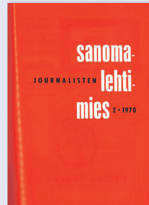
Sanomalehtimiesliiton aluepäiviä käsiteltiin Sanomalehtimiehen numerossa 2/1970. Jutun otsikko oli ”Purnaa, toivoo, pelkää, vaatii”.

Katso Journalistiliiton tulevat tapahtumat ja koulutukset: journalistiliitto.fi