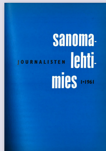
Sanomalehtimies 1/1961 kiittää tiedotusmiehiä, joilta toimittaja saa usein vastauksen ”kuin apteekin hyllyltä”.

Työntekijäjärjestöjen toimintaa saa kritisoida. Kohtuullista kuitenkin olisi, että julkista keskustelua käytäisiin faktojen eikä mielikuvien perusteella. ●