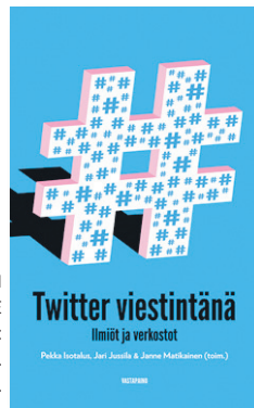
PEKKA ISOTALUS, JARI JUSSILA JA JANNE MATIKAINEN (TOIM.): TWITTER VIESTINTÄNÄ. VASTAPAINO.

Viestinnän, tarinankerronnan ja journalismin asiantuntemusta voi käyttää monenlaisissa tehtävissä, eikä pelkästään journalistisissa tehtävissä. On paljon ihmisiä, jotka työskentelevät jatkuvasti aidan molemmilla puolilla ja pitävät itse huolen hygieniasta. Näin se on ollut minusta jo pidempään.